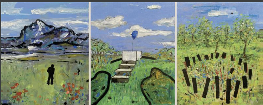
Niek van de Koot

Alle exposanten beantwoorden ieder voor zich de vraag 'waar rouw jij' om? Met hun in het Rietveldpaviljoen tentoongestelde kunstwerken en foto's verbeelden ze de emoties die deze vraag oproept en de manier waarop ze - ieder voor zich - met die emoties omgaan. Zij kunnen bij uitstek zichtbaar en voelbaar maken, wat niet in woorden alleen te vatten is.