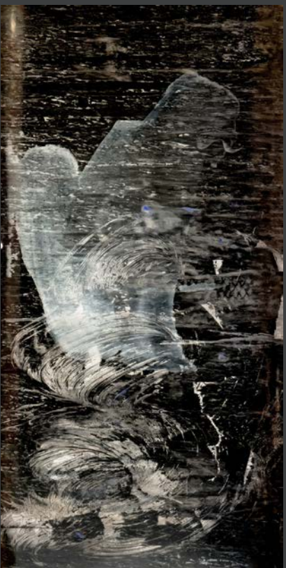
Heleen van Tilburg

Het Rietveldpaviljoen combineert de beeldende kunstwerken met het werk van 12 geselecteerde fotografen. Zij kregen de opdracht de thematiek te verbeelden waarover je rouwt, waarom je rouwt en hoe je verlies verwerkt. Ook hier vertellen de beelden een persoonlijk verhaal: in kleur of zwart wit, direct registrerend, als toeschouwer of participerend, of door middel van metaforen; ze vertellen over het afscheid nemen of over fasen van rouwen om onherroepelijk verlies te aanvaarden. Daarbij komt soms ook tot uiting dat het fotograferen zelf een middel kan zijn om met verlies om te gaan.